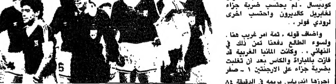
الحكم المكسيكي كوبيسك يرفع البطاقة الصفراء لمارادونا

اتهم النجم الأرجنتيني ديبغو مارادونا الحكم المكسيكي لبطافة نهائي كأس العالم باحتساب ضربة جزاء خاطئة الاجد من اجل ارضاء الاتحاد الدولي لكرة القدم (الفيفا) وتجنب لعب ضربة الجزاء الترجيحية.